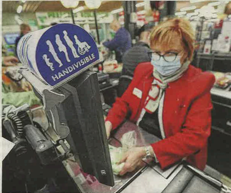
L'application Handvisible est reliée à un boîtier installé en caisse.